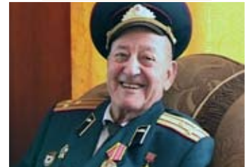
Герой Советского Союза Э. Джумагулов