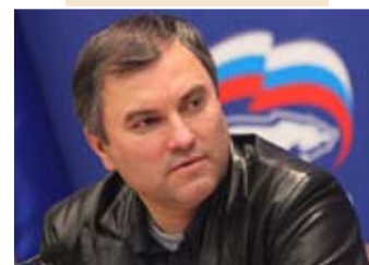
Первый заместитель руководителя Администрации Президента РФ В. В. Володин