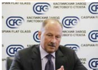
Председатель Внешэкономбанка В. Дмитриев