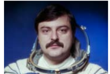
Летчик-космонавт СССР, Герой Советского Союза М. Манаров

Большая работа в республике проводится для того, чтобы изменить сложившийся негативный образ Дагестана и дагестанцев в российских средствах массовой информации. В г. Дербенте в рамках международного культурно-исторического фестиваля «Дербент на перекрестке цивилизаций» организована пресс-конференция с журналистами. Проведено несколько пресс-туров для журналистов и блогеров как федеральных, так и республиканских СМИ. Празднование юбилея древнего Дербента в соответствии с Указом Президента РФ В. В. Путина должно привести к повышению интереса россиян к Дербенту и Дагестану.