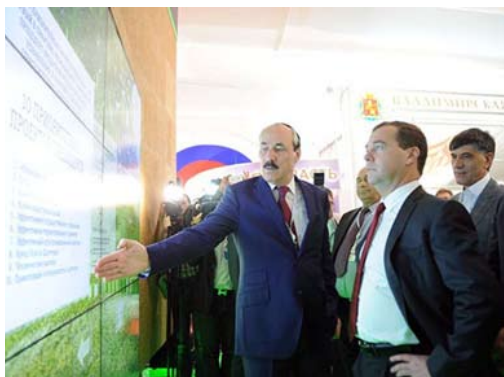
Председатель Правительства РФ Дмитрий Медведев у стенда Республики Дагестан. Санкт-Петербург, 2013 г.

Республика активно ведет конгрессно-выставочную деятельность. В текущем году мы были представлены на таких крупных международных форумах, как «Сочи 2013» и Петербургский международный экономический форум. Дагестан представил один из интересных, по словам Д. А. Медведева, стендов.