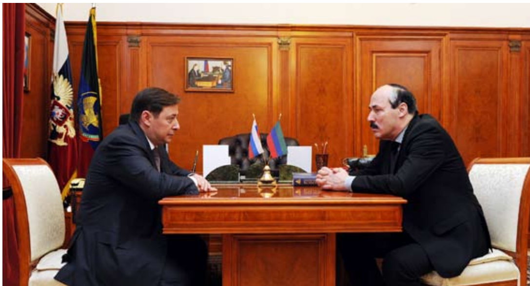
Рабочая встреча Заместителя Председателя правительства РФ – полпреда Президента РФ в СКФО А. Хлопонина с Главой РД Р. Абдулатиповым. Махачкала, 21 марта 2013 г.

По разным оценкам, объем «теневого» капитала в республике составляет от 40 до 60 процентов валового регионального продукта.