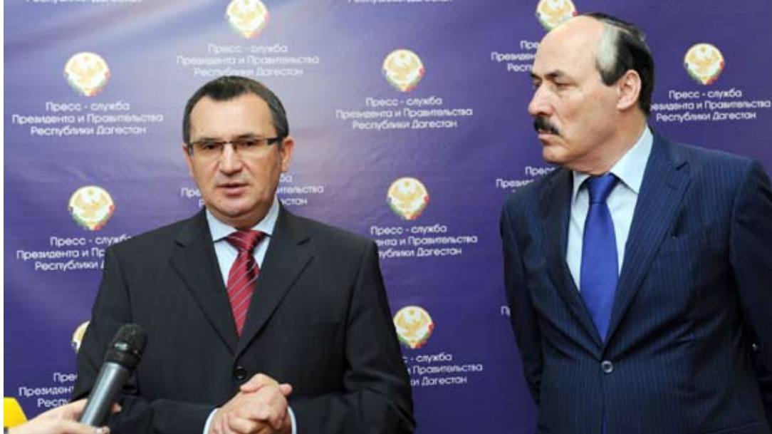
Министр сельского хозяйства РФ Николай Федоров и Глава РД Рамазан Абдулатипов. Махачкала, совещание по проблемам АПК.

ком, не имеющим аналогов как в республике, так и во всем Северо-Кавказском федеральном округе. Главными результатами реализации проекта являются создание новых рабочих мест и поступление дополнительных налоговых доходов в республиканский бюджет. Это в ближайшее время должно существенно изменить социально-экономическое положение населенных пунктов Кизлярского района. Проект ООО «Дагагрокомплекс», использующего новейшие технологии ведения сельского хозяйства, является локомотивом развития аграрного сектора экономики Дагестана.