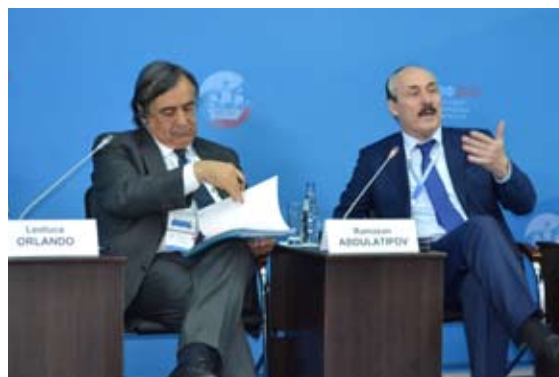
Рамазан Абдулатипов и мэр Палермо Леолука Орландо. Санкт-Петербург, 2013 г.