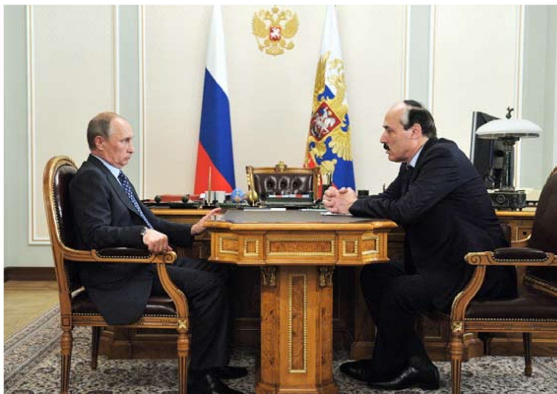
Рабочая встреча Президента РФ В. Путина с Главой РД Р. Абдулатиповым. Ново-Огарево, 15 августа 2013 г.

В этом буклете собраны ключевые приоритетные проекты развития Республики Дагестан. Результат – экономический рывок и обеспечение республики динамичными «точками роста» экономики, достижение нового качества жизни, управления и культурной среды.