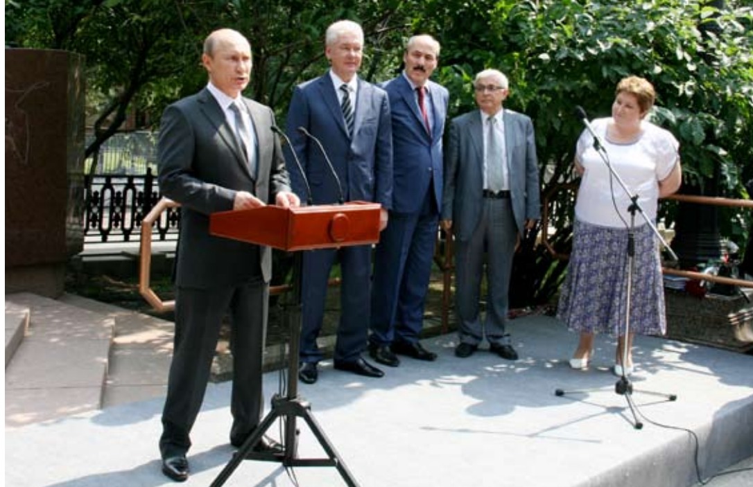
Открытие памятника выдающемуся поэту и общественному деятелю Расулу Гамзатову. Москва, 5 июля

Расул Гамзатов был истинным сыном своего народа, настоящим мужчиной. В его имени и звон сабли, и мудрость стихов, в его стихах – великие традиции предков, сила и величие гор, равнин, трагическая и великая история Кавказа.