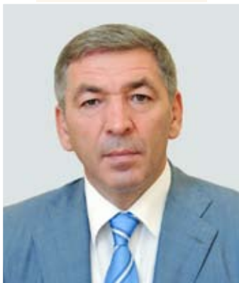
Председатель Правительства РД А. Гамидов

«Многие города в республике «уничтожены» в смысле отсутствия современной урбанистической культуры, населенные пункты застроены торговыми точками, в них нет места для нормального проживания человека. Что касается столицы, то это один из приоритетов развития республики. Прилегающие к городу территории, привлекательные для вложения инвестиций, застроены непонятными строениями без соблюдения архитектурных, санитарных, экологических и прочих норм. Нужны проекты градостроительства и агломераций высокого уровня»