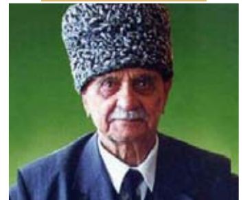
Герой России А. Исмаилов