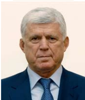
Председатель Народного Собрания РД Х. Шихсаидов

Модернизация системы государственного управления неразрывно связана с определением оптимальных параметров, способствующих формированию открытой и динамичной системы. Для эффективной модели необходим комплексный подход, в том числе кадровая реформа с созданием эффективной структуры государственного аппарата, реализация бюджетной политики, внедрение системы электронного документооборота и системы проектного управления, проведение антикоррупционных мероприятий.