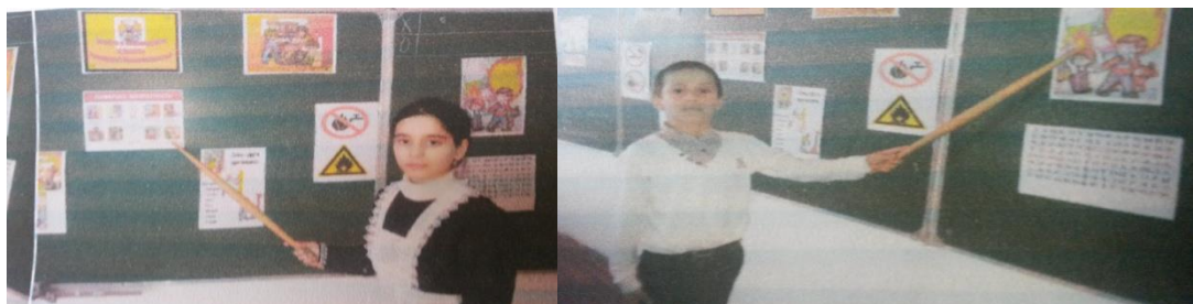
Внеклассное мероприятие по ПБ в 1-9 классах

Внеклассное мероприятие на тему : «Знайте и соблюдайте правила пожарной безопасности»