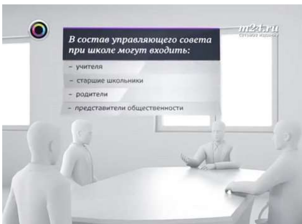
Как работает управляющий совет при школе

Совет распределяет школьные средства, устанавливает режим занятий, в том числе продолжительность учебной недели. Орган утверждает программу развития школы, решает вопросы, связанные с питанием, формой, безопасностью и здоровьем детей. Также совет определяет профили обучения в старшей школе и выбирает учебники из числа допущенных министерством образования.